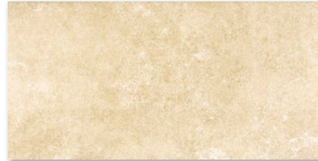
6060-0126 bej/beige | mat/matt PEI 4