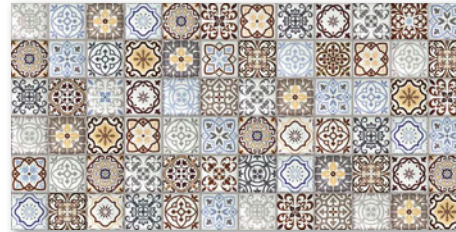
6060-0210 Terrazzo multicolor/multicolour | mat/matt PEI 5