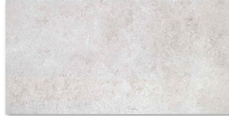
6060-0124 gri deschis/light gray | mat/matt PEI 5