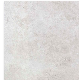
6035-0181 gri deschis/light gray | mat/matt PEI 5