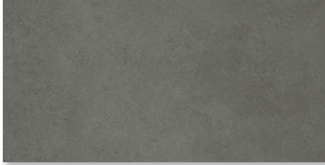
6060-0125 antracit/anthracite | mat/matt PEI 4