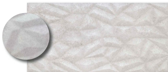
2060-0110 gri deschis/light gray | mat/matt