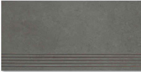
6806-0047 antracit/anthracite | mat/matt PEI 4