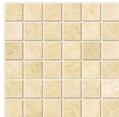
6100-0090 bej/beige | mat/matt SET = 1 folie PEI 4