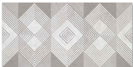
2660-0102 gri/gray | mat/matt