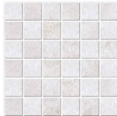
6100-0089 gri deschis/light gray | mat/matt SET = 1 folie PEI 5