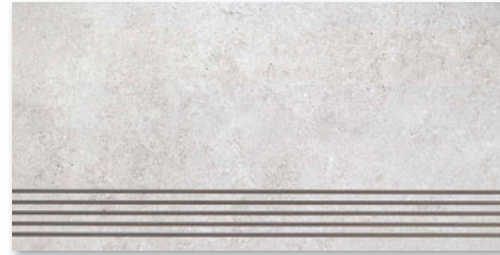
6806-0046 gri deschis/light gray | mat/matt PEI 5