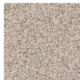
6035-0344 gri/gray | mat/matt PEI 5