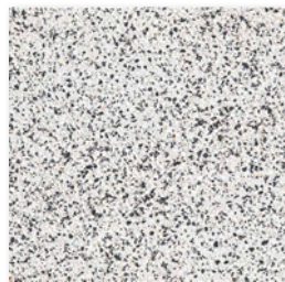
6806-0039 maro/brown | mat/matt PEI 4