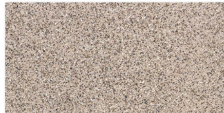
6060-0271 gri/gray | mat/matt PEI 5