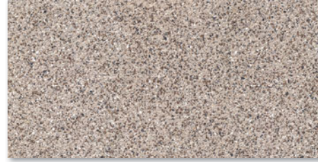
6060-0282 mat/matt PEI 4