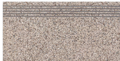
6806-0039 mat/matt PEI 4