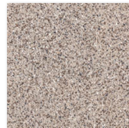
6035-0354 maro/brown | mat/matt PEI 5