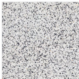
6035-0344 gri/gray | mat/matt PEI 5