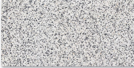
6060-0271 mat/matt PEI 5