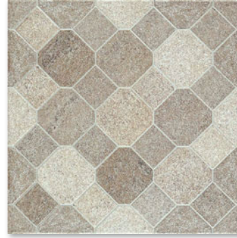
6046-0140 gri/gray | mat/matt PEI 4