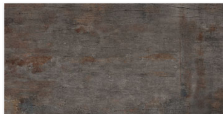
6060-0286 antracit/anthracite | mat/matt PEI 4