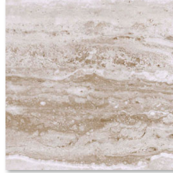
4046-0127 bej/beige | lucios/glossy PEI 3