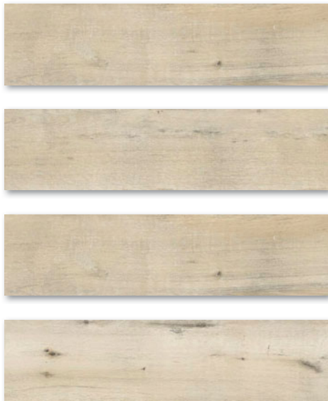
6463-0031 bej/beige | mat/matt PEI 4