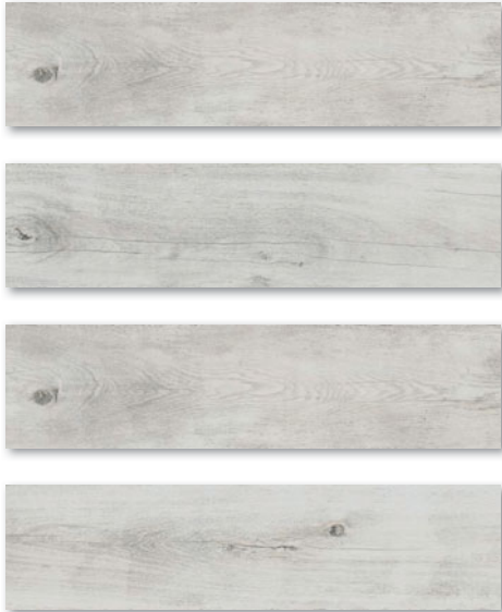
6463-0033 gri/gray | mat/matt PEI 4