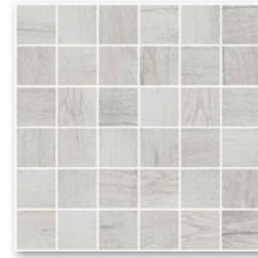
6100-0109 gri/gray | mat/matt SET = 1 folie PEI 4