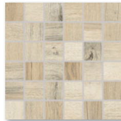
6100-0107 bej/beige | mat/matt SET = 1 folie PEI 4