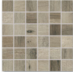
6100-0108 maro/brown | mat/matt SET = 1 folie PEI 4