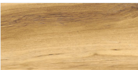
6460-0288 bej/beigel mat/matt PEI 4