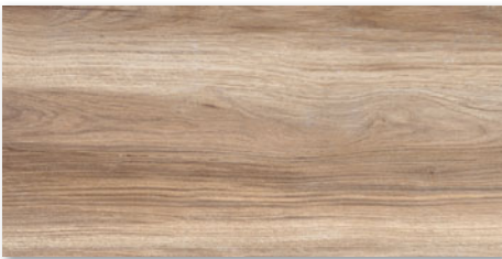
6460-0287 maro-gri/brown-gray | mat/matt PEI 4