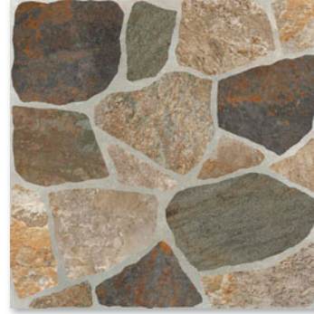
6046-0438 multicolor/multicolour | mat/matt PEI 4