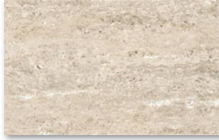
2042-0365 bej/beige | mat/matt