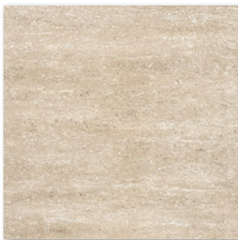
6046-0131 bej/beige | mat/matt PEI 5