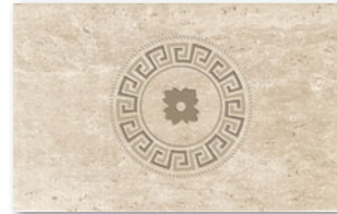
2642-0449 bej/beige | mat/matt