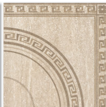
6646-0009 bej/beige | mat/matt PEI 5