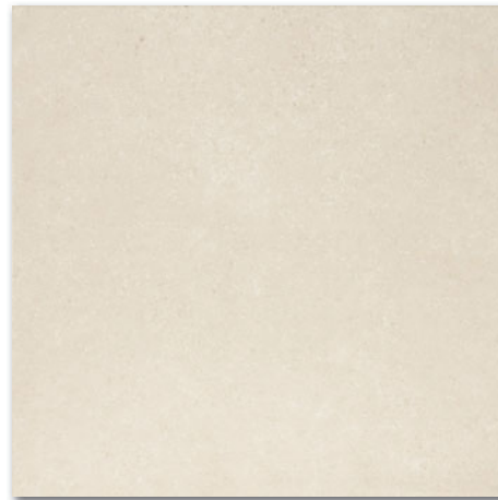
6461-0157 / DAK63431 PEI 5 mat | matt bej deschis / light beige