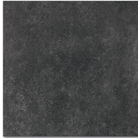
6461-0163 / DAK63433 PEI 4 mat | matt negru / black