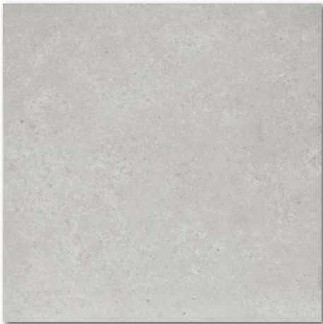
6461-0162 / DAK63432 PEI 4 mat | matt gri deschis / light gray