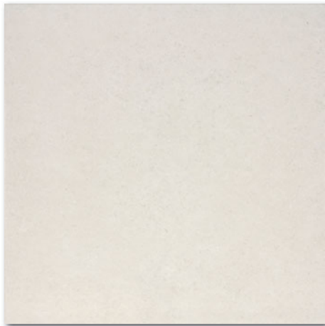
6461-0160 / DAK63430 PEI 5 mat | matt ivoriu / ivory