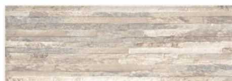
6064-0112 gri deschis/light gray | mat/matt PEI 4