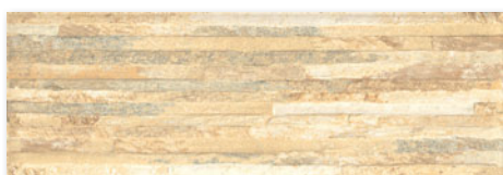
6064-0113 bej deschis/light beige | mat/matt PEI 4