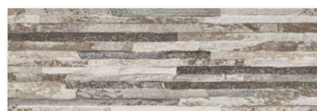
6064-0506 maro/brown | mat/matt PEI 4