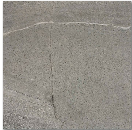
6061-0011 / DAK63679 PEI 5 mat | matt gri închis / dark gray