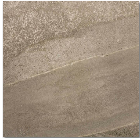
6061-0009 / DAK63677 PEI 5 mat | matt maro / brown