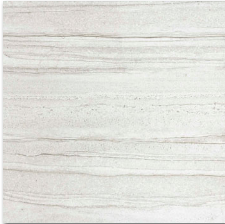
6061-0010 / DAK63678 PEI 5 mat | matt gri deschis / light gray