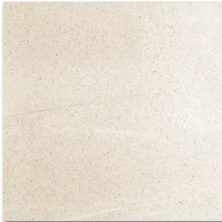
6061-0008 / DAK63676 PEI 5 mat | matt bej deschis / light beige