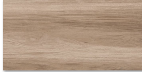
6460-0287 maro-gri/brown-gray | mat/matt PEI 4