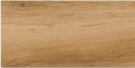
6460-0288 bej/beigel mat/matt PEI 4