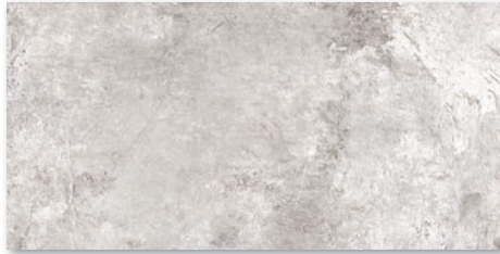
6060-0211 gri/gray | mat/matt PEI 4