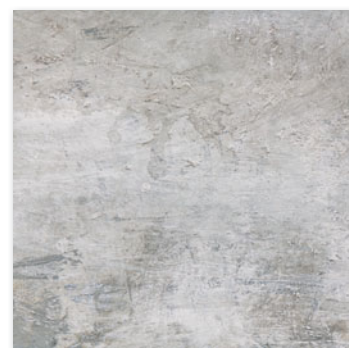
6046-0366 gri/gray | mat/matt PEI 5