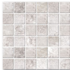
6100-0088 gri/gray | mat/matt SET = 1 folie PEI 4