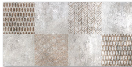
6060-0191 gri/gray | mat/matt PEI 5