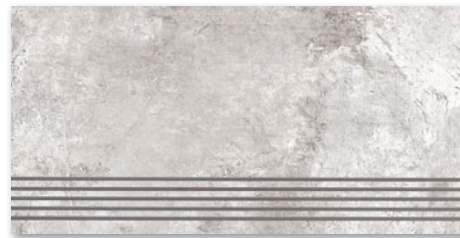
6806-0037 gri/gray | mat/matt PEI 4