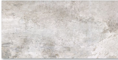
6060-0190 gri/gray | mat/matt PEI 4