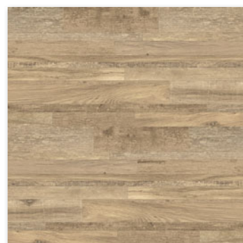
6046-0450 Natura bej/beige | mat/matt PEI 4