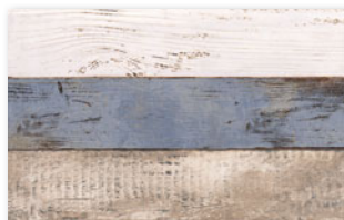
2042-0519 multicolor/multicolor | mat/matt