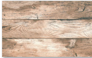
2042-0518 maro/brown | mat/matt