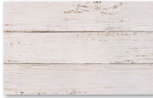
2042-0517 alb/white | mat/matt