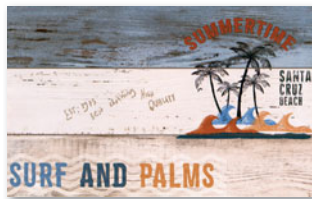
2042-0520 multicolor/multicolor | mat/matt