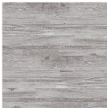
6046-0451 Natura grej/greige | mat/matt PEI 5