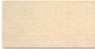
2041-0128 bej/beige | lucios/glossy