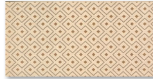
2641-0121 bej/beige | lucios/glossy