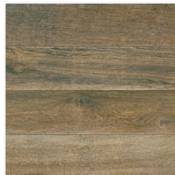
6046-0137 Norway maro/brown | mat/matt PEI 4