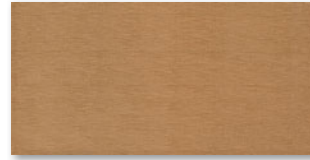
2041-0148 caramel/caramel | lucios/glossy